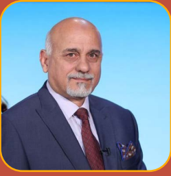
قصيدة : الشاعر حارث الأزدي